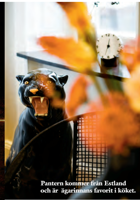
Pantern kommer från Estland och är ägarinnans favorit i köket.