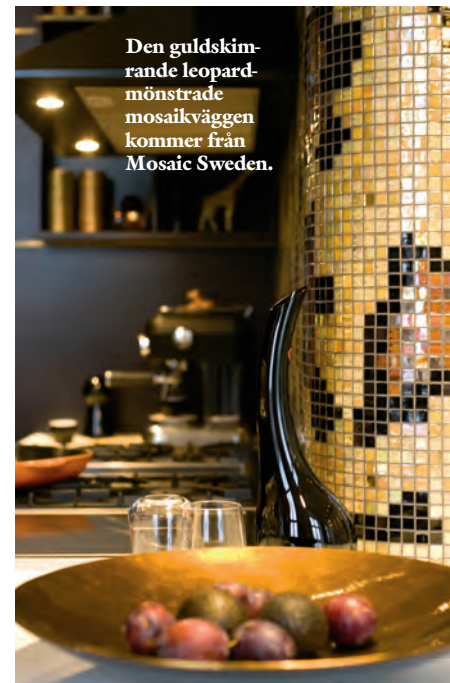
Den guldkimrande leopardmönstrade mosaikväggen kommer från Mosaic Sweden.