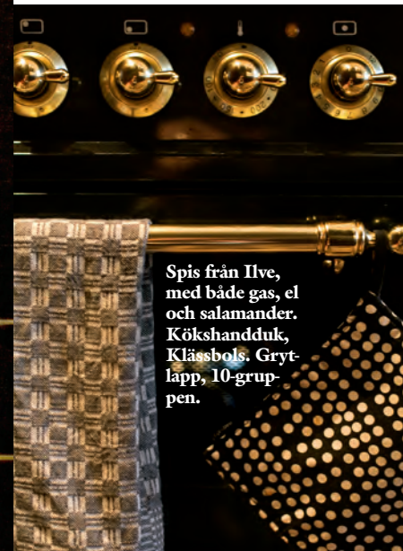
Spis från Ilve, med både gas, el och salamander. Kökshandduk, Klässbols. Grytlapp, 10-gruppen.