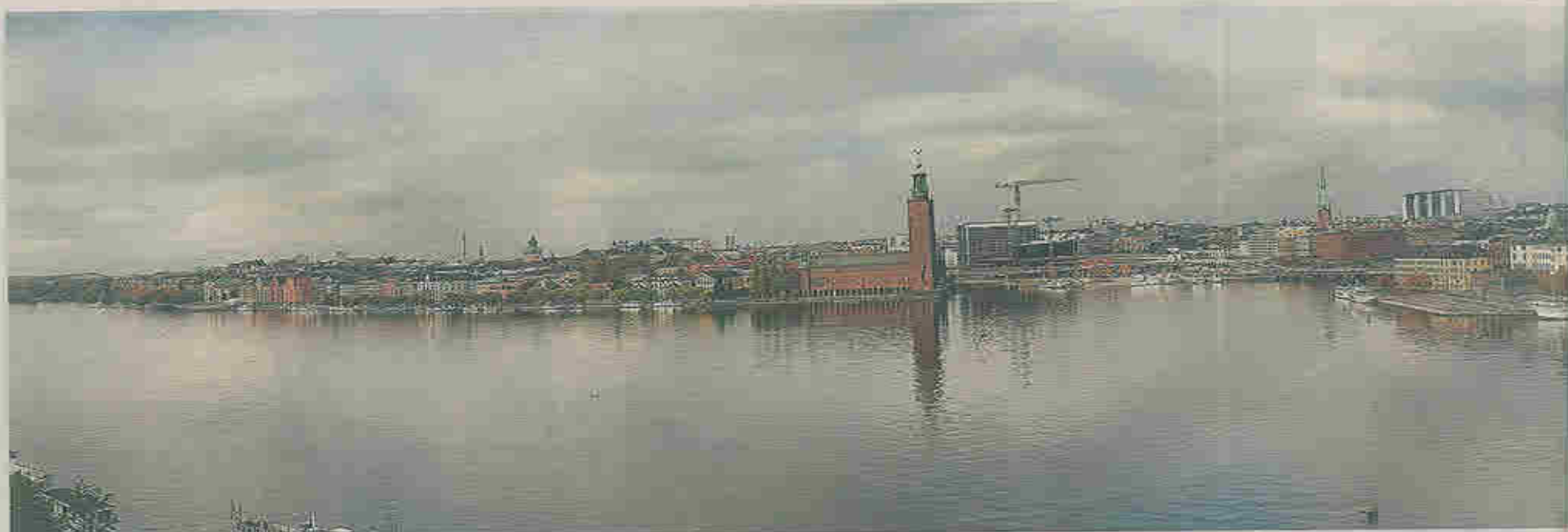
I beskrivningen av Stockholms innerstad som riksintresse nämns bland annat "vyerna från viktiga utsiktspunkter, blickfång, kontakten med vattnet". Här nämns också stadens silhuett, "med den begränsade hushöjden där i stort sett bara kyrkorna och offentliga byggnader tillåts höja sig över mängden". Panorambilden här ovan är ett montage av av elva bilder.